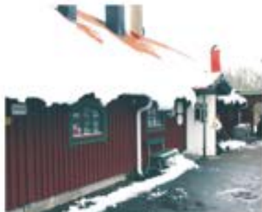
Det ända kaminererna fick plats på taket av snö.