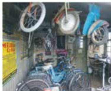
Sandbloms Velocipedverkotat, som har en alldeles egen hemvist med det ärliga, men salade namnet: www.yngve-sandblom.se och påsgården.

ANN-LOUISE KJELLNER redaktion@svenljunga.com