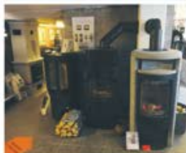
Kaminer i alla former och färger.